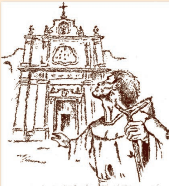
Il Beato Giacomo e il suo Santuario, in un disegno da un vecchio numero del Bollettino.

chesi popolare. Al monogramma "JHS" dei loro fratelli dell'Osservanza, detti Padri anteposero un'insegna ancor più eloquente e chiaramente distintiva della loro spiritualità: lo stemma inquartato con simboli della Passione, incassato sull'ingresso seicentesco del convento. Il richiamo al Crocifisso si fece ancor più esplicito nella cappella del Beato Giacomo, la cui urna era sottoposta, sull'altare, ad un elo-