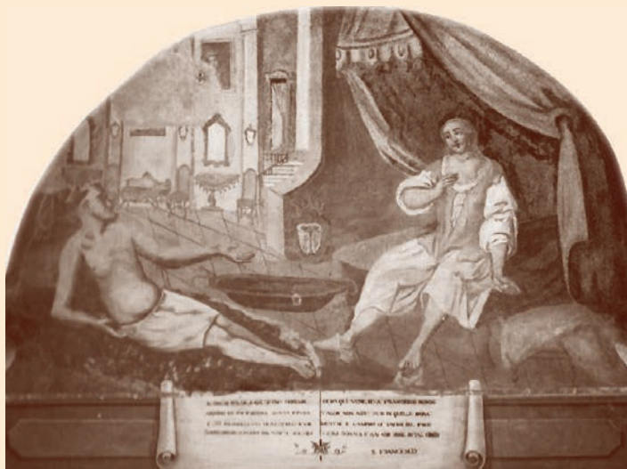
“S. Francesco nel castello di Bari”, affresco settecentesco nel chiostro del santuario del Beato Giacomo. Archivolto dell'antica cappella bitettese di san Francesco riutilizzato sull'ingresso della “Nunziatella”.

L'insediamento stabile di una cellula francescana in loco , nei primi decenni del '400, è quindi frutto maturo di un progressivo cammino sulle orme del Padre Serafico. In data 7 luglio 1432, papa Eugenio IV faceva pervenire a mons. Arcamone, vescovo di Bitetto, il suo assenso alla fondazione di un convento francescano, prendendo atto che la popolazione era sinceramente tesa a “ricevere insegnamenti di salvezza [e] permutare i beni terreni con quelli celesti”. Così, l'anno successivo, nel complesso conventuale eretto in località Gallicello , ponevano dimora i Frati Minori dell'Osservanza, quei francescani cioè che si richiamavano ad una osservanza integrale della Regola . La scelta del luogo, prospiciente la scarpata dell'attigua