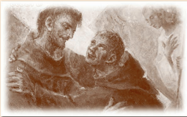
Il Beato Giacomo e S. Francesco, in un dipinto di Gaetano Valerio.

chesi popolare. Al monogramma "JHS" dei loro fratelli dell'Osservanza, detti Padri anteposero un'insegna ancor più eloquente e chiaramente distintiva della loro spiritualità: lo stemma inquartato con simboli della Passione, incassato sull'ingresso seicentesco del convento. Il richiamo al Crocifisso si fece ancor più esplicito nella cappella del Beato Giacomo, la cui urna era sottoposta, sull'altare, ad un elo-