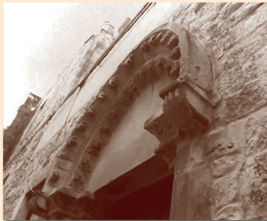
L'archivolto della Nunziatella

Il subentro, nel '600, dei PP. Riformati a quelli dell'Osservanza portò ad accentuare la teologia cristocentrica quale fulcro della cate-